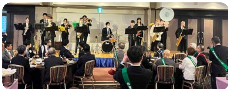
鎮西学院大学ジャズアンサンブルローターアクトクラブ による演奏