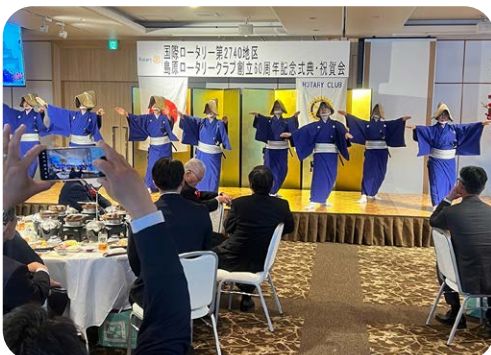
島原七万石を踊る会