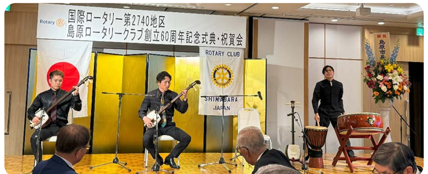
津軽三味線 FUGEN による演奏