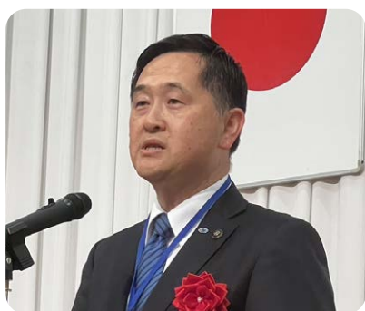
馬場 昭治 天草市長