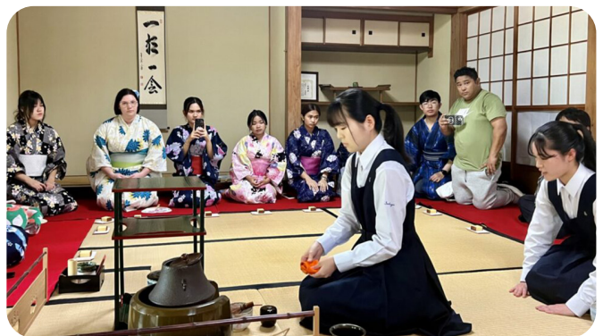
御書院にて留学生と諫早高校生徒との緑陰茶会